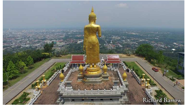
(핫야이 공원에서 바라본 시내 전경)