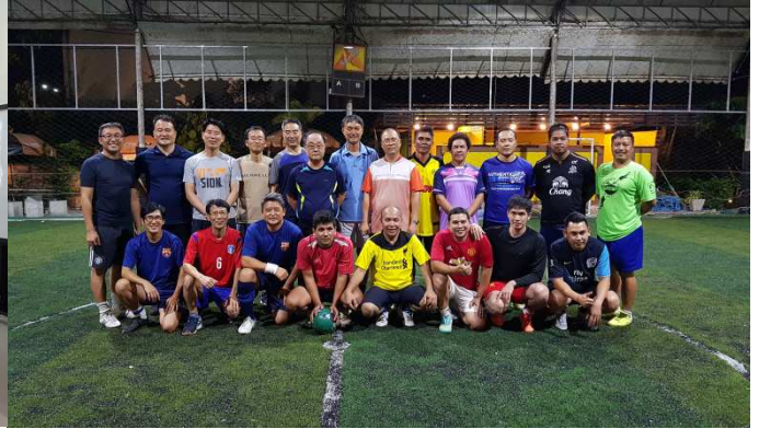
수라타니 현지인 목회자들과 축구시합