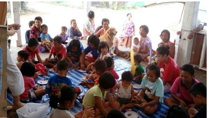
뒤쪽에 동네 어른들도 무엇을 하나 관심 있어 같이 예배

씨사켓사역은 저희가 방콕에서 사역하던 마하타이센타 동네사람들의 고향 입니다. 현지에서 장소를 제공해 주신 할머니님과 어린이집 선생님께 감사드립니다.