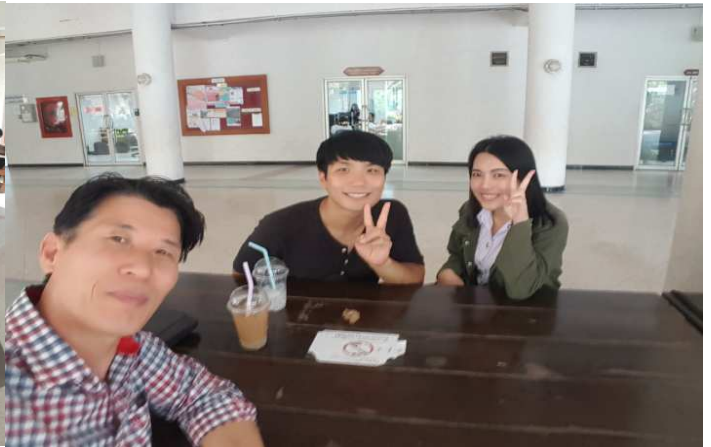
송클라대 한국어과 3학년 처리처