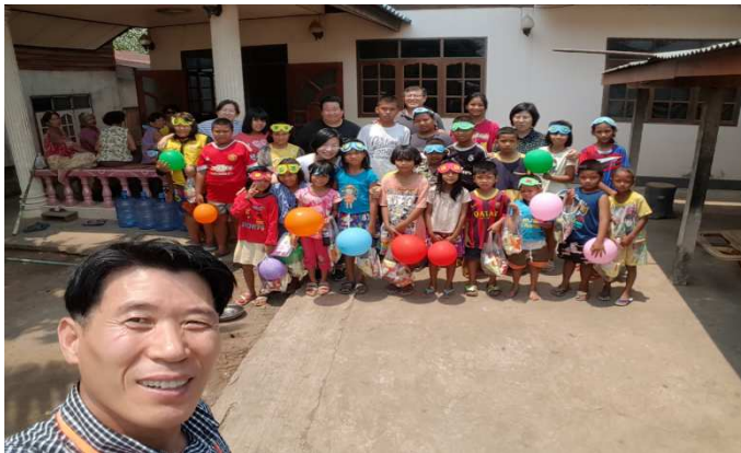
반빠타이 마을 뽀묵할머니 집에서 예배