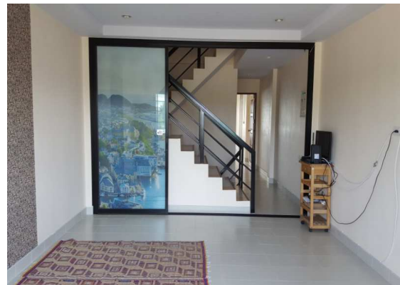
2층 목장(그룹셀)과 기숙사 공간 ↓

코리안 센터는 전 세입자가 공부방을 6개월 가량 운영하다 폐쇄함. 저희에게 필요한 인테리어를 주님이 인도하셨음을 깨달았습니다. ↑