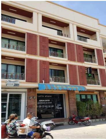
1층 천막이 있는 건물이 코리안센터