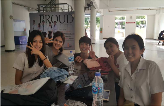
송클라대 3학년 중국어학과 싸리의 친구들