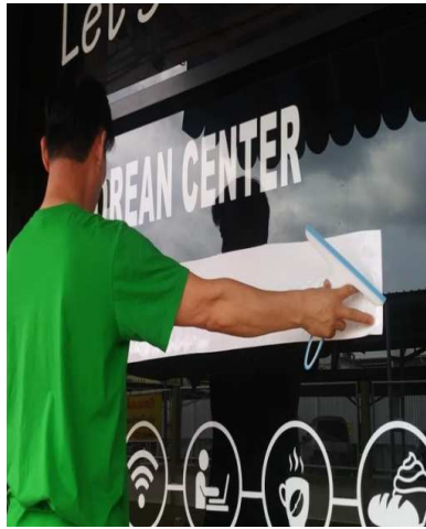
스티커 작업 중~