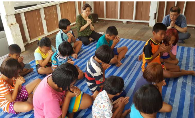
반야이 마을 정자에서 예배