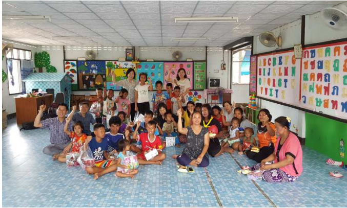
군안면 싹따숙마을의 어린이집을 즉석에서 빌려줌