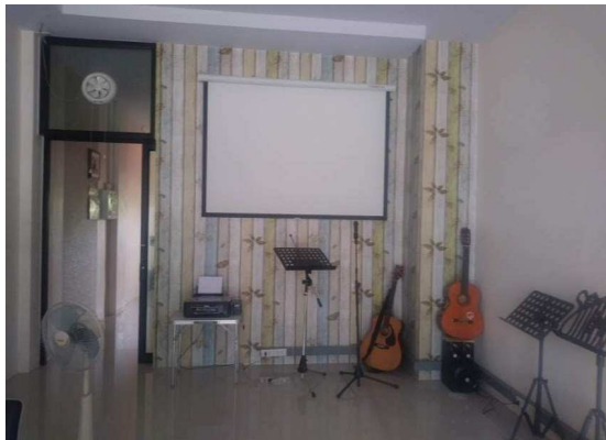
1층 메인 체플이 진행 될 장소 ↓