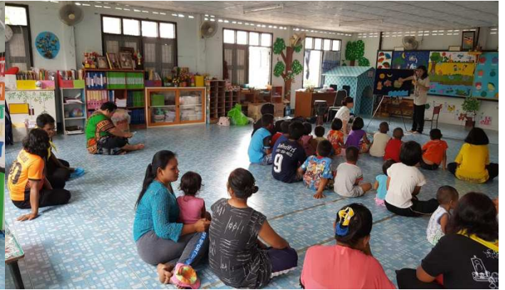
동네 어린이들과 예배 (대부분 아이들이 예배를 처음 들여봄)